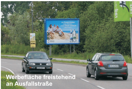
Werbefläche freistehend an Ausfallstraße

| Vermieten Sie uns freie, ungenützte Außenflächen ihrer Liegenschaften, z.B. an Parkplätzen, Grünstreifen oder unbebauten Grundstücken zur Errichtung unserer Werbeträger und sichern sich dadurch regelmäßige Mieteinnahmen.