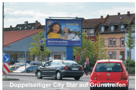
Doppelseitiger City Star auf Grünstreifen

| Sämtliche Kosten für die erforderlichen Baugenehmigungen und den fachgerechten Aufbau gehen zu Lasten der Firma CityCom. Eine regelmäßige Kontrolle und Wartung der Werbeanlage durch Fachpersonal wird Ihnen garantiert.