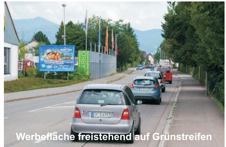
Werbefläche freistehend auf Grünstreifen

| Sämtliche Kosten für die erforderlichen Baugenehmigungen und den fachgerechten Aufbau gehen zu Lasten der Firma CityCom. Eine regelmäßige Kontrolle und Wartung der Werbeanlage durch Fachpersonal wird Ihnen garantiert.