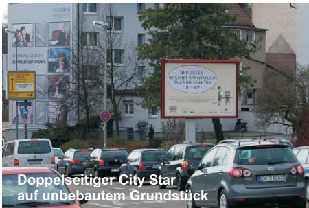
Doppelseitiger City Star auf unbebautem Grundstück

| Die Werbeflächen haben ein Format von 3,70m x 2,70m (BxH) und werden mit Pfosten auf Freiflächen aufgestellt.